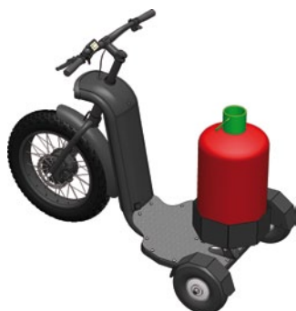
OPTION "support bouteille de gaz 13 kg"