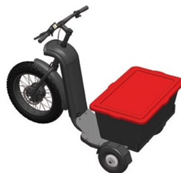
OPTION "caisse 90 L"